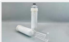
型号 : MAX-O-M9透明系列 尺寸 Size : \varnothing 44 \times 189/210/220/240 mm 流量 Flow : 2000-4000ml/min 工作压力 Working pressure : 0.1-0.4MPa 可于高温下使用 Can be used at high temperature