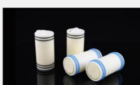
型号 : MAX-O-M4 尺寸 Size : \varnothing 40 \times 80 mm 流量 Flow : 1000-4000ml/min 工作压力 Working pressure : 0.1-0.4MPa