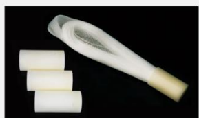
型号 : MAX-B-M13 尺寸 Size : \text{Ø}27 \times 200\text{mm} 流量 Flow : 500-2000ml/min 工作压力 Working pressure : 0.1-0.4MPa