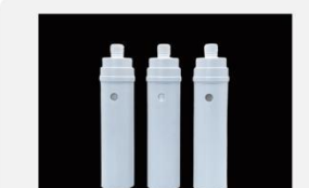
型号 : MAX-O-M8瓷白系列 尺寸 Size : \varnothing 44 \times 189/210 mm 流量 Flow : 2000-4000ml/min 工作压力 Working pressure : 0.1-0.4MPa