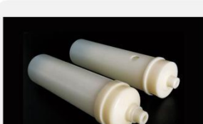
型号 : MAX-O-M10锁牙系列 尺寸 Size : \varnothing 44 \times 180/175 mm 流量 Flow : 2000-4000ml/min 工作压力 Working pressure : 0.1-0.4MPa 1/4" 螺纹 thread