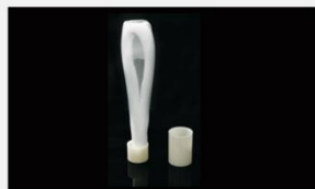
型号 : MAX-B-M14 尺寸 Size : \text{Ø}30 \times 185\text{mm} 流量 Flow : 500-2000ml/min 工作压力 Working pressure : 0.1-0.4MPa