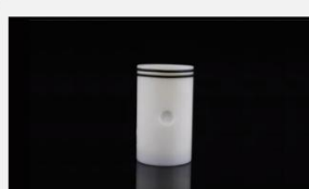
型号 : MAX-O-M5 尺寸 Size : \varnothing 44 \times 75 mm 流量 Flow : 1000-4000ml/min 工作压力 Working pressure : 0.1-0.4MPa