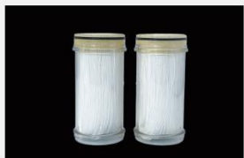
型号 : MAX-T-0021 尺寸 Size : \varnothing 37 \times 82 mm 流量 Flow : 1000-4000ml/min 工作压力 Working pressure : 0.1-0.4MPa