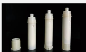
型号 : MAX-O-M7系列, 有插口 尺寸 Size : \varnothing 44 \times 189/210/220/240/250 mm 流量 Flow : 2000-4000ml/min 工作压力 Working pressure : 0.1-0.4MPa