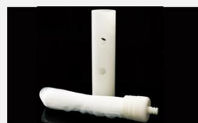
型号 : MAX-B-M28 尺寸 Size : \text{Ø}60 \times 253\text{mm} 流量 Flow : 2000-8000ml/min 工作压力 Working pressure : 0.1-0.4MPa 可用PS、PVDF膜丝 PS/PVDF fiber