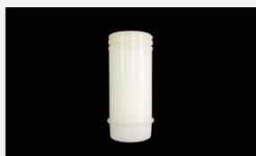
型号 : MAX-O-M1 尺寸 Size : \varnothing 30 \times 68 mm 流量 Flow : 1000-4000ml/min 工作压力 Working pressure : 0.1-0.4MPa