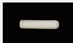
型号 : MAX-B-M30(10" ) 尺寸 Size : \text{Ø}65 \times 250\text{mm} 流量 Flow : 3000-10000ml/min 工作压力 Working pressure : 0.1-0.4MPa 可用PS、PVDF膜丝 PS/PVDF fiber