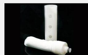
型号 : MAX-B-M29 尺寸 Size : \text{Ø}60 \times 218\text{mm} 流量 Flow : 2000-8000ml/min 工作压力 Working pressure : 0.1-0.4MPa 可用PS、PVDF膜丝 PS/PVDF fiber