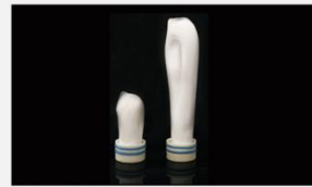
型号 : MAX-B-M15 尺寸 Size : \text{Ø}41 \times 100/200\text{mm} 流量 Flow : 1000-4000ml/min 压力 Pressure : 0.1-0.4MPa 可用PS、PVDF膜丝 PS/PVDF fiber