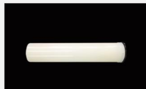
型号 : MAX-O-M3 尺寸 Size : \varnothing 34 \times 165 mm 流量 Flow : 2000-4000ml/min 工作压力 Working pressure : 0.1-0.4MPa