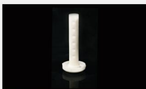
型号 : MAX-O-M34 尺寸 Size : \varnothing 21 \times 128 mm 流量 Flow : 100-1000ml/min 工作压力 Working pressure : 0.01-0.2MPa 碳棒内芯 Carbon rod filling