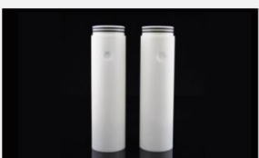
型号 : MAX-O-M6无盖系列 尺寸 Size : \varnothing 44 \times 134/156/180/200 mm 流量 Flow : 3000-5000ml/min 工作压力 Working pressure : 0.1-0.4MPa