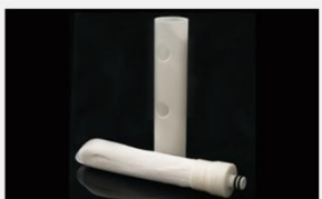
型号 : MAX-B-M27 尺寸 Size : \text{Ø}45 \times 235\text{mm} 流量 Flow : 2000-4000ml/min 工作压力 Working pressure : 0.1-0.4MPa 可用PS、PVDF膜丝 PS/PVDF fiber