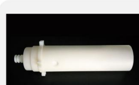
型号 : MAX-O-M11 尺寸 Size : \varnothing 44 \times 191 mm 流量 Flow : 2000-4000ml/min 工作压力 Working pressure : 0.1-0.4MPa