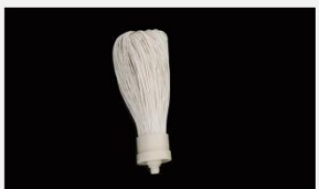
型号 : MAX-B-M35 尺寸 Size : \text{Ø}45 \times 200\text{mm} 流量 Flow : 2000-5000ml/min 工作压力 Working pressure : 0.1-0.4MPa 可用PS、PVDF膜丝 PS/PVDF fiber 1/4" 螺纹 thread