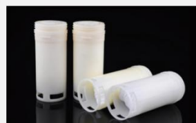
型号 : MAX-T-0053 尺寸 Size : \text{Ø}47 \times 114 mm 流量 Flow : 4000-5000ml/min 工作压力 Working pressure : 0.1-0.4MPa