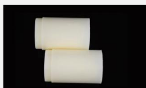
型号 : MAX-O-M2 尺寸 Size : \varnothing 44 \times 50/60/100/200 mm 流量 Flow : 1000/1200/2000/4000ml/min 工作压力 Working pressure : 0.1-0.4MPa