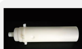
型号 : MAX-O-M11 尺寸 Size : \varnothing 44 \times 191 mm 流量 Flow : 2000-4000ml/min 工作压力 Working pressure : 0.1-0.4MPa