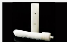
型号 : MAX-B-M28 尺寸 Size : \text{Ø}60 \times 253\text{mm} 流量 Flow : 2000-8000ml/min 工作压力 Working pressure : 0.1-0.4MPa 可用PS、PVDF膜丝 PS/PVDF fiber