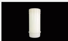
型号 : MAX-O-M1 尺寸 Size : \varnothing 30 \times 68 mm 流量 Flow : 1000-4000ml/min 工作压力 Working pressure : 0.1-0.4MPa