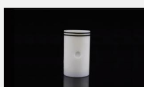
型号 : MAX-O-M5 尺寸 Size : \varnothing 44 \times 75 mm 流量 Flow : 1000-4000ml/min 工作压力 Working pressure : 0.1-0.4MPa