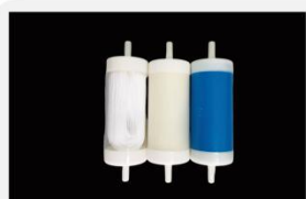
型号 : MAX-T-0001A

尺寸 Size : \text{Ø}40 \times 133\text{mm} 流量 Flow : 1000-4000ml/min 工作压力 Working pressure : 0.05-0.4MPa