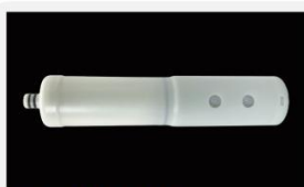
型号 : MAX-F-M6 尺寸 Size : Ø60×285mm 流量 Flow : 2000-6000ml/min 压力 Pressure :0.1-0.4MPa 前段 : 炭棒/PP棉 Front section : carbon rod, PP cotton