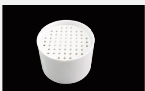
型号 : MAX-T-9323 尺寸 Size : \text{Ø}49 \times 34 mm 流量 Flow : 100-500ml/min 工作压力 Working pressure : 0.01-0.1MPa