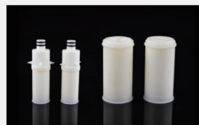
型号 : MAX-T-0030 尺寸 Size : \text{Ø}34 \times 122 mm 流量 Flow : 500-3500ml/min 工作压力 Working pressure : 0.05-0.4MPa