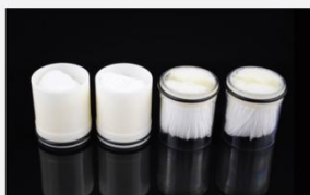
型号 : MAX-T-0033 尺寸 Size : \text{Ø}35 \times 40 mm 流量 Flow : 800-2000ml/min 工作压力 Working pressure : 0.1-0.4MPa