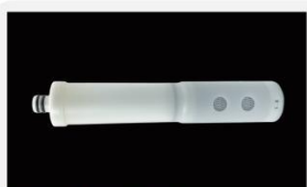
型号 : MAX-F-M5 尺寸 Size : Ø44×250mm 流量 Flow : 1000-4000ml/min 压力 Pressure :0.1-0.4MPa 前段 : 炭棒/PP棉 Front section : carbon rod, PP cotton