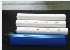
型号 : MAX-C-M31 尺寸 Size : Ø63×500mm 流量 Flow : 10-20L/min 工作压力 Working pressure : 0.1-0.4MPa