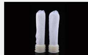
型号 : MAX-B-M17 尺寸 Size : \text{Ø}50 \times 200\text{mm} 流量 Flow : 2000-4000ml/min 工作压力 Working pressure : 0.1-0.4MPa 可用PS、PVDF膜丝 PS/PVDF fiber