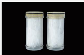
型号 : MAX-T-0021 尺寸 Size : \text{Ø}37 \times 82 mm 流量 Flow : 1000-4000ml/min 工作压力 Working pressure : 0.1-0.4MPa