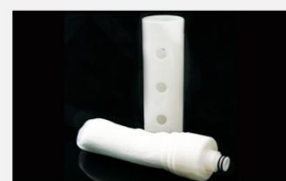
型号 : MAX-B-M29 尺寸 Size : \text{Ø}60 \times 218\text{mm} 流量 Flow : 2000-8000ml/min 工作压力 Working pressure : 0.1-0.4MPa 可用PS、PVDF膜丝 PS/PVDF fiber