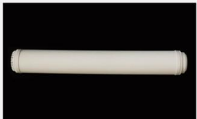
型号 : MAX-C-M30(20" ) 尺寸 Size : Ø65×500mm 流量 Flow : 10-20L/min 工作压力 Working pressure : 0.1-0.4MPa