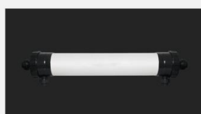
型号 : 8040 尺寸 Size : \varnothing 200 \times 1500 mm 流量 Flow : 8T/h 工作压力 Working pressure : 0.1-0.4MPa 接口 Connector : DN50