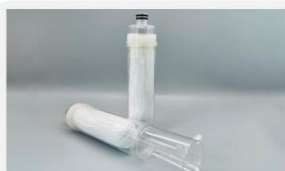
型号 : MAX-O-M9透明系列 尺寸 Size : \varnothing 44 \times 189/210/220/240 mm 流量 Flow : 2000-4000ml/min 工作压力 Working pressure : 0.1-0.4MPa 可于高温下使用 Can be used at high temperature