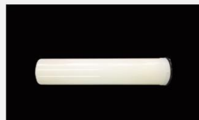
型号 : MAX-O-M3 尺寸 Size : \varnothing 34 \times 165 mm 流量 Flow : 2000-4000ml/min 工作压力 Working pressure : 0.1-0.4MPa