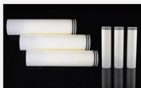
型号 : MAX-T-0043 尺寸 Size : \text{Ø}36 \times 154 mm 流量 Flow : 2000-4000ml/min 工作压力 Working pressure : 0.1-0.4MPa