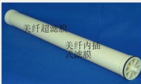
型号 : 4040 尺寸 Size : \varnothing 90 \times 1110 mm 流量 Flow : 1T/h 工作压力 Working pressure : 0.1-0.4MPa