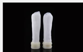
型号 : MAX-B-M18 尺寸 Size : \text{Ø}51 \times 200\text{mm} 流量 Flow : 2000-4000ml/min 工作压力 Working pressure : 0.1-0.4MPa 可用PS、PVDF膜丝 PS/PVDF fiber