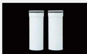
型号 : MAX-T-0060 尺寸 Size : \text{Ø}30 \times 81 mm 流量 Flow : 1000-3000ml/min 工作压力 Working pressure : 0.1-0.4MPa