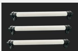
型号 : 4040 尺寸 Size : \varnothing 90 \times 1210 mm 接口 Connector : \varnothing 32 , DN25 流量 Flow : 1T/h 工作压力 Working pressure : 0.1-0.4MPa