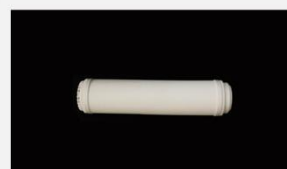
型号 : MAX-B-M30(10" ) 尺寸 Size : \text{Ø}65 \times 250\text{mm} 流量 Flow : 3000-10000ml/min 工作压力 Working pressure : 0.1-0.4MPa 可用PS、PVDF膜丝 PS/PVDF fiber