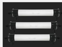
型号 : 6040 尺寸 Size : \varnothing 150 \times 1420 mm 流量 Flow : 4T/h 工作压力 Working pressure : 0.1-0.4MPa 接口 Connector : DN40