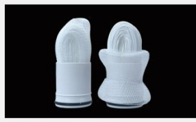
型号 : MAX-B-M11 尺寸 Size : \text{Ø}31 \times 80 mm 流量 Flow : 500-2000ml/min 工作压力 Working pressure : 0.1-0.4MPa