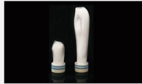
型号 : MAX-B-M15 尺寸 Size : \text{Ø}41 \times 100/200\text{mm} 流量 Flow : 1000-4000ml/min 压力 Pressure : 0.1-0.4MPa 可用PS、PVDF膜丝 PS/PVDF fiber