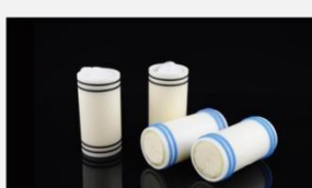
型号 : MAX-O-M4 尺寸 Size : \varnothing 40 \times 80 mm 流量 Flow : 1000-4000ml/min 工作压力 Working pressure : 0.1-0.4MPa