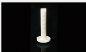
型号 : MAX-O-M34 尺寸 Size : \varnothing 21 \times 128 mm 流量 Flow : 100-1000ml/min 工作压力 Working pressure : 0.01-0.2MPa 碳棒内芯 Carbon rod filling