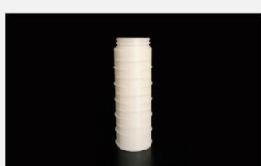
型号 : MAX-T-0009

尺寸 Size : \text{Ø}40 \times 110\text{mm} 流量 Flow : 1000-4000ml/min 工作压力 Working pressure : 0.1-0.4MPa