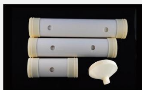
型号 : MAX-C-M35 尺寸 Size : \varnothing 90 \times 420 mm Flow : 15L/min 工作压力 Working pressure : 0.1-0.4MPa Customizable size