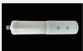
型号 : MAX-F-M6 尺寸 Size : Ø60×285mm 流量 Flow : 2000-6000ml/min 压力 Pressure :0.1-0.4MPa 前段 : 炭棒/PP棉 Front section : carbon rod, PP cotton