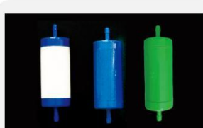
型号 : MAX-T-0001B

尺寸 Size : \text{Ø}40 \times 133\text{mm} 流量 Flow : 1000-4000ml/min 工作压力 Working pressure : 0.05-0.4MPa