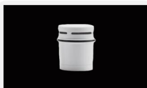
型号 : MAX-0.1-50B 尺寸 Size : Ø57×64mm 组合 : 颗粒炭+离子交换树脂 Combination: Particle carbon + ion exchange resin 流量 Flow : 170-200ml/min 压力 : 无压自滴 Pressure: no pressure