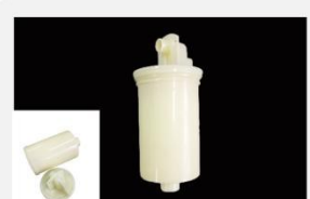
型号 : MAX-T-0005

尺寸 Size : \text{Ø}30 \times 80\text{mm} 流量 Flow : 1000-3000ml/min 工作压力 Working pressure : 0.1-0.4MPa