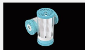
型号 : MAX-C-M33(10" ) 尺寸 Size : Ø117×254mm 流量 Flow : 10-15L/min 工作压力 Working pressure :0.1-0.4MPa