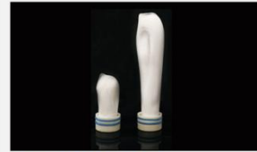
型号 : MAX-B-M15 尺寸 Size : \text{Ø}41 \times 100/200\text{mm} 流量 Flow : 1000-4000ml/min 压力 Pressure : 0.1-0.4MPa 可用PS、PVDF膜丝 PS/PVDF fiber