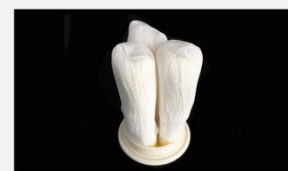
型号 : MAX-C-M34 尺寸 Size : Ø125×250/500mm 流量 Flow : 20L/min 40L/min 工作压力 Working pressure :0.1-0.4MPa