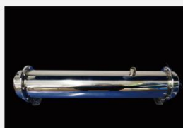
型号 : MAX-C-M36 尺寸 Size : \varnothing 102 \times 610 mm 流量 Flow : 15L/min 工作压力 Working pressure : 0.1-0.4MPa Customizable size