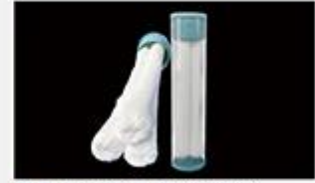
型号 : MAX-C-M33(20" ) 尺寸 Size : Ø117×510mm 流量 Flow : 25-30L/min 工作压力 Working pressure : 0.1-0.4MPa