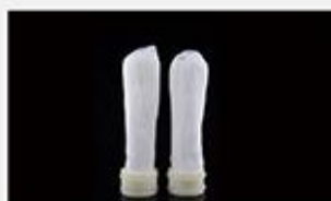
型号 : MAX-B-M18 尺寸 Size : Ø51×200mm 流量 Flow : 2000-4000ml/min 工作压力 Working pressure : 0.1-0.4MPa 可用PS、PVDF膜丝 PS/PVDF fiber