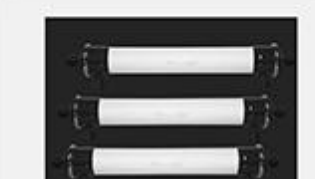
型号 : 6040 尺寸 Size : Ø150×1420mm 流量 Flow : 4T/h 工作压力 Working pressure : 0.1-0.4MPa 接口Connector : DN40