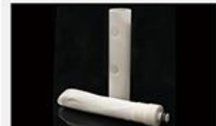
型号 : MAX-B-M27 尺寸 Size : Ø45×235mm 流量 Flow : 2000-4000ml/min 工作压力 Working pressure : 0.1-0.4MPa 可用PS、PVDF膜丝 PS/PVDF fiber