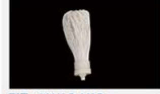
型号 : MAX-B-M35 尺寸 Size : Ø45×200mm 流量 Flow : 2000-5000ml/min 工作压力 Working pressure : 0.1-0.4MPa 可用PS、PVDF膜丝 PS/PVDF fiber 1/4" 螺纹 thread