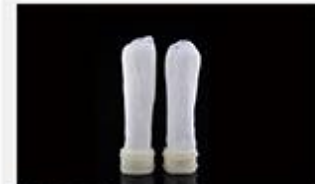
型号 : MAX-B-M16 尺寸 Size : Ø53×200mm 流量 Flow : 2000-6000ml/min 工作压力 Working pressure : 0.1-0.4MPa 可用PS、PVDF膜丝 PS/PVDF fiber