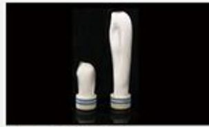
型号 : MAX-B-M15 尺寸 Size : Ø41×100/200mm 流量 Flow : 1000-4000ml/min 压力 Pressure : 0.1-0.4MPa 可用PS、PVDF膜丝 PS/PVDF fiber