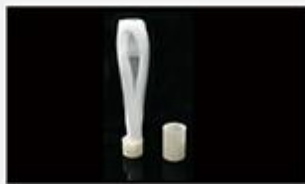
型号 : MAX-B-M14 尺寸 Size : Ø30×185mm 流量 Flow : 500-2000ml/min 工作压力 Working pressure : 0.1-0.4MPa