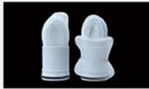
型号 : MAX-B-M11 尺寸 Size : Ø31×80mm 流量 Flow : 500-2000ml/min 工作压力 Working pressure : 0.1-0.4MPa