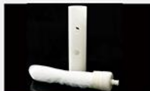
型号 : MAX-B-M28 尺寸 Size : Ø60×253mm 流量 Flow : 2000-8000ml/min 工作压力 Working pressure : 0.1-0.4MPa 可用PS、PVDF膜丝 PS/PVDF fiber