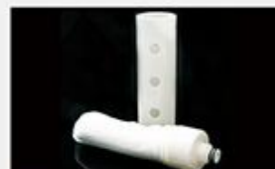
型号 : MAX-B-M29 尺寸 Size : Ø60×218mm 流量 Flow : 2000-8000ml/min 工作压力 Working pressure : 0.1-0.4MPa 可用PS、PVDF膜丝 PS/PVDF fiber