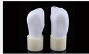
型号 : MAX-B-M12 尺寸 Size : Ø25×110mm 流量 Flow : 500-2000ml/min 工作压力 Working pressure : 0.1-0.4MPa