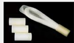
型号 : MAX-B-M13 尺寸 Size : Ø27×200mm 流量 Flow : 500-2000ml/min 工作压力 Working pressure : 0.1-0.4MPa