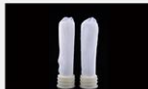
型号 : MAX-B-M17 尺寸 Size : Ø50×200mm 流量 Flow : 2000-4000ml/min 工作压力 Working pressure : 0.1-0.4MPa 可用PS、PVDF膜丝 PS/PVDF fiber