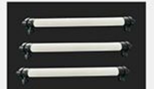
型号 : 4040 尺寸 Size : Ø90×1210mm 接口 Connector : Ø32 , DN25 流量 Flow : 1T/h 工作压力 Working pressure : 0.1-0.4MPa