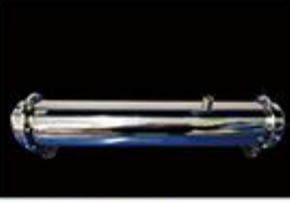
型号 : MAX-C-M36 尺寸 Size : Ø102×610mm 流量 Flow : 15L/min 工作压力 Working pressure : 0.1-0.4MPa Customizable size