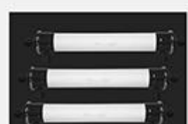
型号 : 6040 尺寸 Size : Ø150×1420mm 流量 Flow : 4T/h 工作压力 Working pressure : 0.1-0.4MPa 接口Connector : DN40