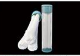
型号 : MAX-C-M33(20" ) 尺寸 Size : Ø117×510mm 流量 Flow : 25-30L/min 工作压力 Working pressure : 0.1-0.4MPa