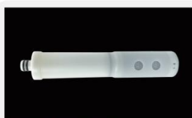
型号 : MAX-F-M5 尺寸 Size : \varnothing 44 \times 250 mm 流量 Flow : 1000-4000ml/min 压力 Pressure : 0.1-0.4MPa 前段 : 炭棒/PP棉 Front section : carbon rod, PP cotton