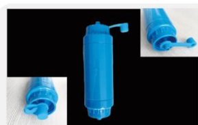
型号 : MAX-T-0001E

尺寸 Size : \text{Ø}40 \times 150\text{mm} 流量 Flow : 1000-4000ml/min 工作压力 Working pressure : 0.05-0.4MPa