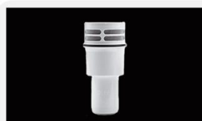
型号 : MAX-0.1-50 尺寸 Size : \varnothing 57 \times 119 mm 组合 : 颗粒炭+超滤膜 Combination: particle carbon+UF 流量 Flow : 100-200ml/min 压力 : 无压自滴 Pressure: no pressure