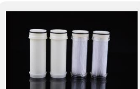
型号 : MAX-T-0002

尺寸 Size : \text{Ø}40 \times 85\text{mm} 流量 Flow : 1000-4000ml/min 工作压力 Working pressure : 0.05-0.4MPa 可乐瓶螺纹 Coke bottle female thread