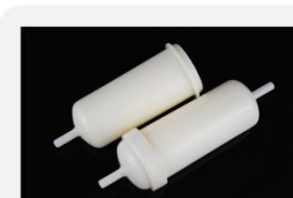
型号 : MAX-T-0003

尺寸 Size : \text{Ø}30 \times 87\text{mm} 流量 Flow : 1000-3000ml/min 工作压力 Working pressure : 0.1-0.4MPa