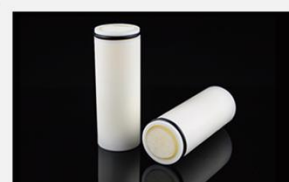
型号 : MAX-T-0008

尺寸 Size : \text{Ø}33 \times 84\text{mm} 流量 Flow : 500-3000ml/min 工作压力 Working pressure : 0.01-0.4MPa