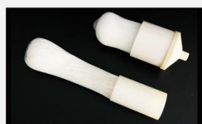
型号 : MAX-C-M32 尺寸 Size : \varnothing 90 \times 200/250/300/400/500 mm 流量 Flow : 10-30L/min 工作压力 Working pressure : 0.1-0.4MPa