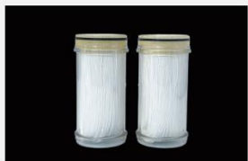
型号 : MAX-T-0021 尺寸 Size : \text{Ø}37 \times 82 mm 流量 Flow : 1000-4000ml/min 工作压力 Working pressure : 0.1-0.4MPa