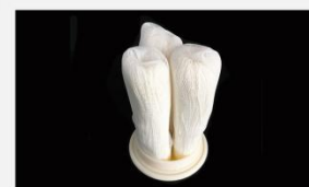
型号 : MAX-C-M34 尺寸 Size : \varnothing 125 \times 250/500 mm 流量 Flow : 20L/min 40L/min 工作压力 Working pressure : 0.1-0.4MPa