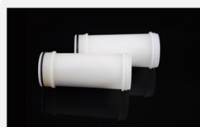
型号 : MAX-T-0004

尺寸 Size : \text{Ø}41 \times 115\text{mm} 流量 Flow : 1000-4000ml/min 工作压力 Working pressure : 0.05-0.4MPa