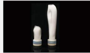
型号 : MAX-B-M15 尺寸 Size : \text{Ø}41 \times 100/200\text{mm} 流量 Flow : 1000-4000ml/min 压力 Pressure : 0.1-0.4MPa 可用PS、PVDF膜丝 PS/PVDF fiber