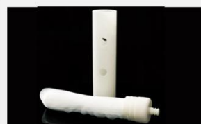
型号 : MAX-B-M28 尺寸 Size : \text{Ø}60 \times 253\text{mm} 流量 Flow : 2000-8000ml/min 工作压力 Working pressure : 0.1-0.4MPa 可用PS、PVDF膜丝 PS/PVDF fiber