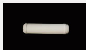
型号 : MAX-B-M30(10" ) 尺寸 Size : \text{Ø}65 \times 250\text{mm} 流量 Flow : 3000-10000ml/min 工作压力 Working pressure : 0.1-0.4MPa 可用PS、PVDF膜丝 PS/PVDF fiber