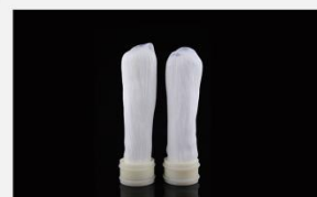
型号 : MAX-B-M18 尺寸 Size : \text{Ø}51 \times 200\text{mm} 流量 Flow : 2000-4000ml/min 工作压力 Working pressure : 0.1-0.4MPa 可用PS、PVDF膜丝 PS/PVDF fiber