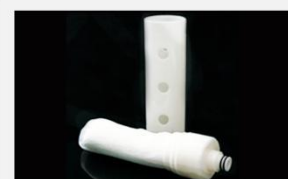
型号 : MAX-B-M29 尺寸 Size : \text{Ø}60 \times 218\text{mm} 流量 Flow : 2000-8000ml/min 工作压力 Working pressure : 0.1-0.4MPa 可用PS、PVDF膜丝 PS/PVDF fiber