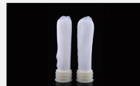
型号 : MAX-B-M17 尺寸 Size : \text{Ø}50 \times 200\text{mm} 流量 Flow : 2000-4000ml/min 工作压力 Working pressure : 0.1-0.4MPa 可用PS、PVDF膜丝 PS/PVDF fiber