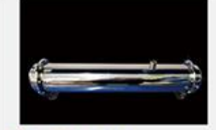
型号 : MAX-C-M36 尺寸 Size : Ø102×610mm 流量 Flow : 15L/min 工作压力 Working pressure : 0.1-0.4MPa Customizable size