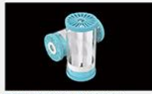
型号 : MAX-C-M33(10" ) 尺寸 Size : Ø117×254mm 流量 Flow : 10-15L/min 工作压力 Working pressure : 0.1-0.4MPa