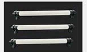
型号 : 4040 尺寸 Size : Ø90×1210mm 接口 Connector : Ø32 , DN25 流量 Flow : 1T/h 工作压力 Working pressure : 0.1-0.4MPa