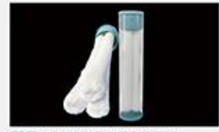
型号 : MAX-C-M33(20" ) 尺寸 Size : Ø117×510mm 流量 Flow : 25-30L/min 工作压力 Working pressure : 0.1-0.4MPa