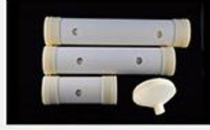
型号 : MAX-C-M35 尺寸 Size : Ø90×420mm Flow : 15L/min 工作压力 Working pressure : 0.1-0.4MPa Customizable size