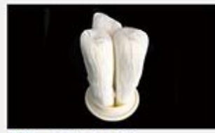
型号 : MAX-C-M34 尺寸 Size : Ø125×250/500mm 流量 Flow : 20L/min 40L/min 工作压力 Working pressure : 0.1-0.4MPa