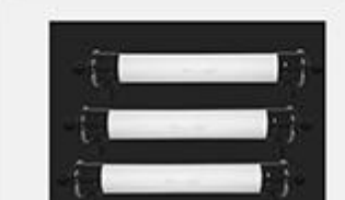
型号 : 6040 尺寸 Size : Ø150×1420mm 流量 Flow : 4T/h 工作压力 Working pressure : 0.1-0.4MPa 接口Connector : DN40