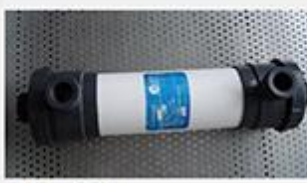
型号 : 4021 尺寸 Size : Ø90×500mm 接口 Connector : Ø32 , DN25 流量 Flow : 480L/h 工作压力 Working pressure : 0.1-0.4MPa