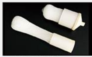
型号 : MAX-C-M32 尺寸 Size : Ø90×200/250/300/400/500mm 流量 Flow : 10-30L/min 工作压力 Working pressure : 0.1-0.4MPa