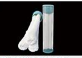
型号 : MAX-C-M33(20" ) 尺寸 Size : Ø117×510mm 流量 Flow : 25-30L/min 工作压力 Working pressure : 0.1-0.4MPa