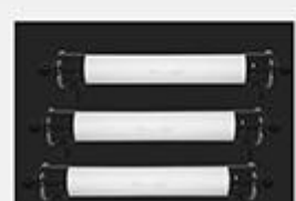
型号 : 6040 尺寸 Size : Ø150×1420mm 流量 Flow : 4T/h 工作压力 Working pressure : 0.1-0.4MPa 接口Connector : DN40