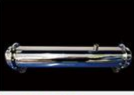
型号 : MAX-C-M36 尺寸 Size : Ø102×610mm 流量 Flow : 15L/min 工作压力 Working pressure : 0.1-0.4MPa Customizable size